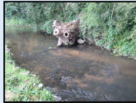
Travaux Morphologie - Vive Parence