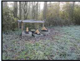
Dispositifs d'abreuvement - Montreteau