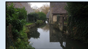
Assistance – manœuvre de vannes