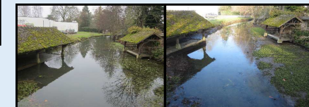
Assistance – Savigné l'Evêque

Assemblée des Propriétaires – Montfort le Gesnois 28/05/2018