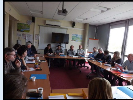
Journée technique – Agence de l'Eau